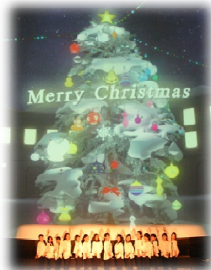
グレイスのみなさんへ

今年度の星空散歩ライブはこれで終了ですが、来年度も多彩なラインナップでお送りします。ホームページやツイッターもチェックしてくださいね。どうぞお楽しみに！